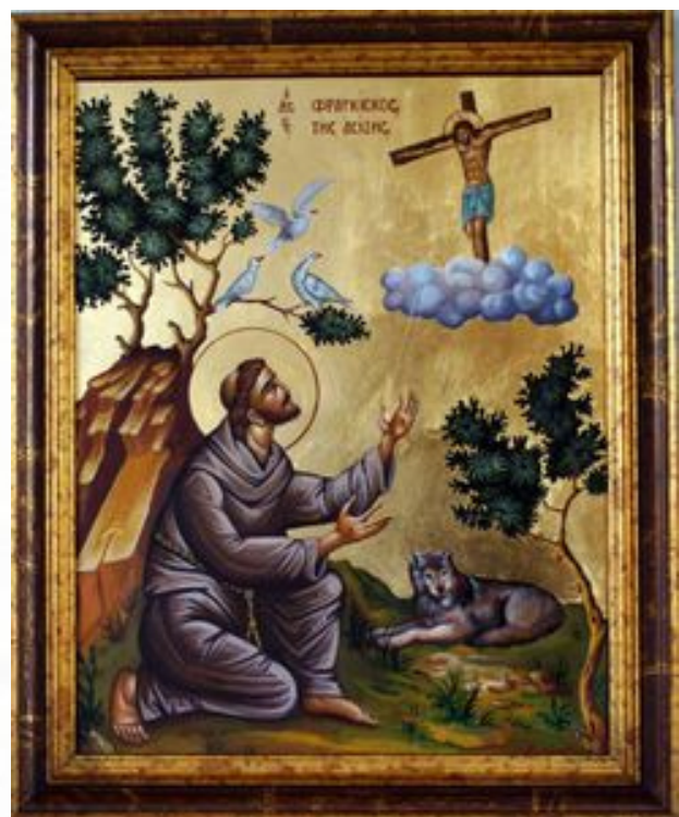
Beispiel: Konzept und Umsetzung der Vitaikone des Hl. Franz von Assisi

links eine erste Skizze, rechts die handgemalte Ikone, die Papst Franziskus 2014 überreicht wurde. Format: 30x40cm ** Idee: Konstantin Kardonas, 2013