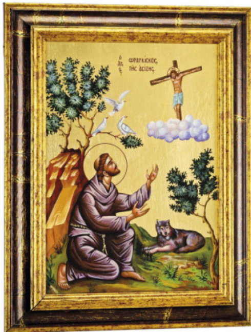
Beispiel 2 Franz von Assisi, gerahmt im Format 27 x 35 cm

Wenn Sie Ihre Ikonen mit Echtholzrahmung bestellt haben, werden die Siebdrucke auf 10mm-MDF kaltverleimt und gerahmt.