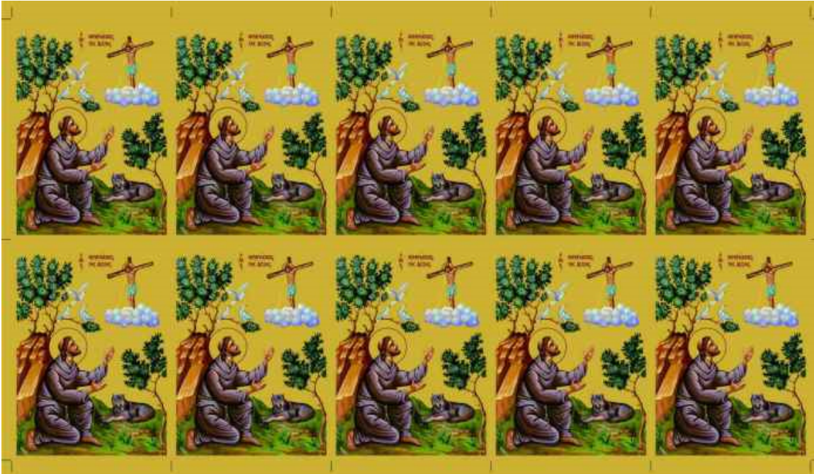
Beispiel: Der originale Druckbogen der Vitaikone des Hl. Franz von Assisi mit Passmarken für den Beschnitt * Größe der einzelnen Ikonen: 19,5 x 26 cm